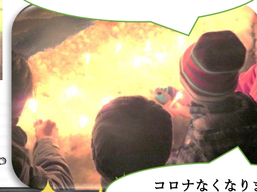
コロナなくなります ように