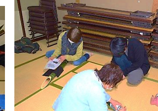
午後の作業に各団体の皆さん、 中学生ボランティアの方に正面の飾り、アマビエ雪 像づくりをお手伝いいただきました