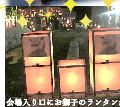
会場入り口にお獅子のランタンが