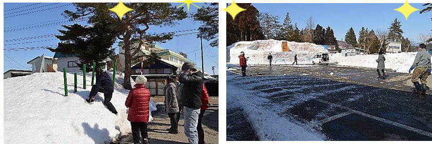
当日の作業にホイルローダーでお手伝い頂きました。