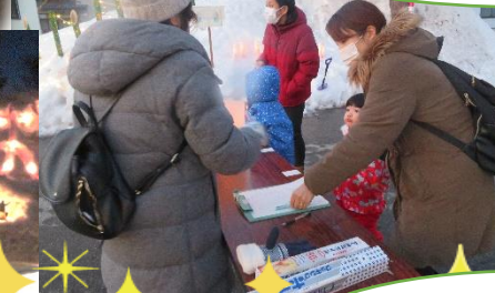
日が沈み次第にロウ ソクの灯りが華やか